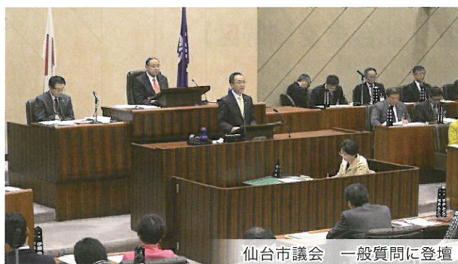
仙台市議会 一般質問に登壇

議会での一般質問等 【第3(9・10月)定例会】・【第4(12月)定例会】における一般質問及び答弁